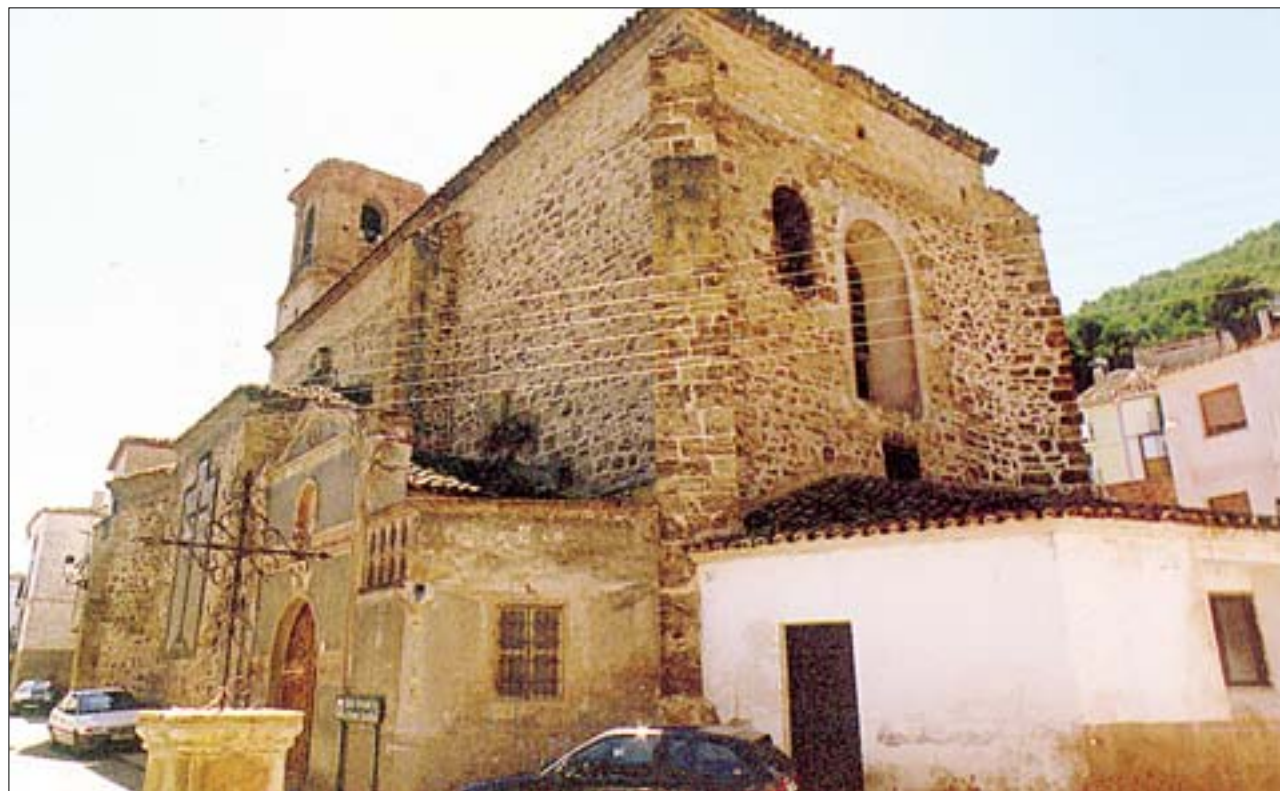
Fachada sur y oeste de la iglesia de la Asunción