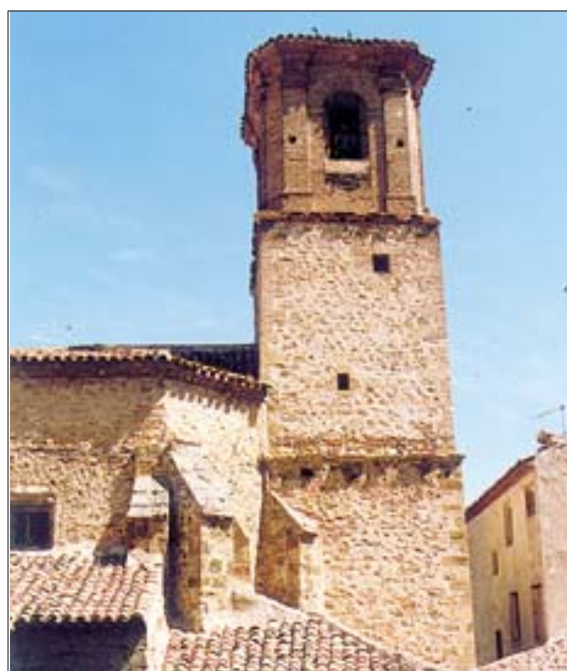
Torre y nave, con las bóvedas estrelladas, de la iglesia de la Asunción