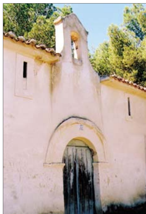
Ermita de Nuestra Señora de la Antigua

De izquierda a derecha, talla románica y talla protogótica de la Virgen de los Remedios o de Gutur (ambas en la iglesia de la Asunción), talla románica de la Virgen del Prado (en la ermita del mismo nombre, en Inestrillas) y talla de Nuestra Señora de la Antigua (en la ermita del mismo nombre)