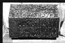
Arqueta de San Formerio siglo XIV

San Formerio es el patrono de Bañares, celebrándose sus fiestas el 25 de septiembre, por lo que ocupa un lugar privilegiado en la iglesia de la Santa Cruz. La talla barroca de San Formerio está dotada de una silueta y un movimiento muy elegantes que encarnan la fuerza y vigor del santo, complementándose esta iconografía con las pinturas alusivas a su vida en el zócalo del retablo. La arqueta relicario de San Formerio es una caja con tapa a doble vertiente realizada en madera forrada con chapas de esmalte. Parece una obra gótica del siglo XIV de alarifes locales con resabios románicos en su diseño. En su decoración se aglutinan esmaltes, motivos heráldicos, vegetales, animales fantásticos, varios personajes y el Calvario. Fue robada en la pasada década y afortunadamente recuperada.