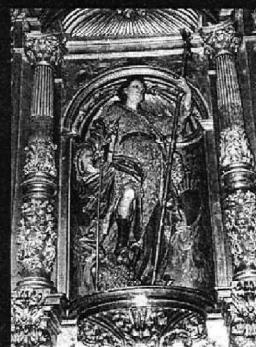
Imagen de San Formerio presidiendo su retablo, siglo XVIII