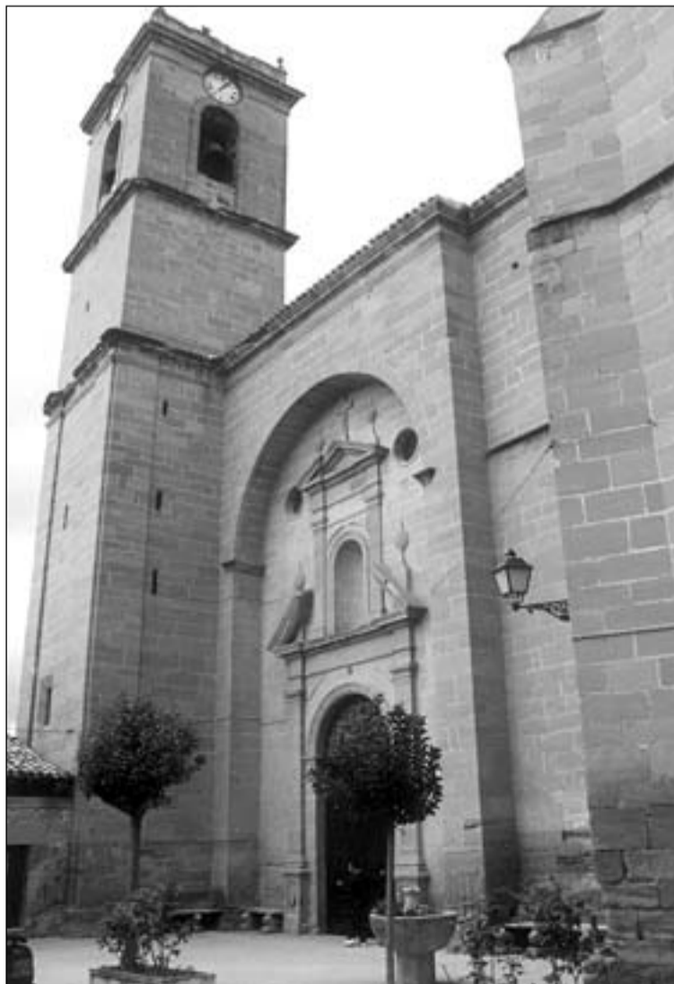
Fachada sur con la portada, la torre y la pila bautismal antigua. A la derecha, talla de San Vitores del siglo XVIII.