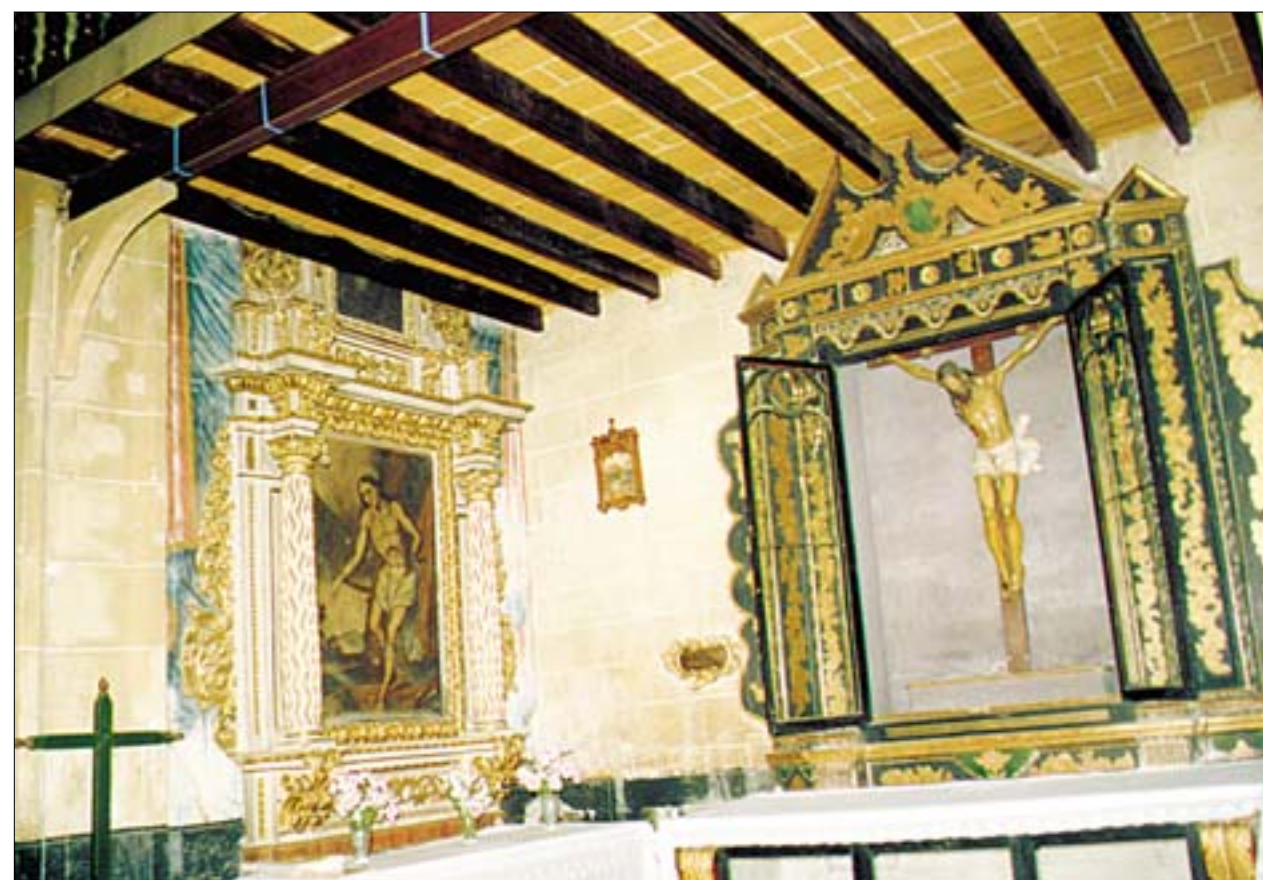
Capilla de San Sebastián, cortada por la expansión del coro alto

Del resto de los retablos de la iglesia, hacemos especial mención al retablo del Cristo que se encuentra situado en la Capilla de San Sebastián, que contiene un bello Crucifijo manierista de mediados del siglo XVI, y al retablo de la capilla de la Virgen de Guadalupe, rococó de mediados del XVIII, que consta de banco, dos cuerpos y tres calles, donde en torno al lienzo de la Virgen de Guadalupe realizado en México en el año 1754, se distribuyen las imágenes de San José, y las de San Joaquín y Santa Ana cuya fiesta conmemoramos en el día de hoy.