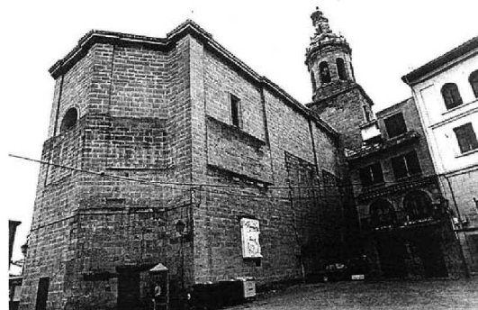
Vista de la iglesia parroquial de San Martín desde la plaza. Los contrafuertes ligeramente resaltados al exterior muestran claramente la división de la nave en cuatro tramos, el abside ochavado en tres paños, y las puertas del penúltimo tramo. Interiormente se desarrollan capillas altas entre los contrafuertes, que en su día soportarían bóvedas tardogóticas. Fue terminada en 1556 cuando trabajaba el cantero Pedro Landeta. Por su planta y arquitectura es uno de los templos prototipo del gótico del siglo XVI en La Rioja.

Las diferencias en la cantería muestran las dos fases constructivas del siglo XVI. La línea horizontal que recorre todo su perímetro indica el levantamiento del alzado de los muros tras su incendio por las tropas de Zumalacáregui en el año 1834, para desalojar a los vecinos de Cenicero que se atrincheraron en la iglesia para impedir el paso de las tropas.