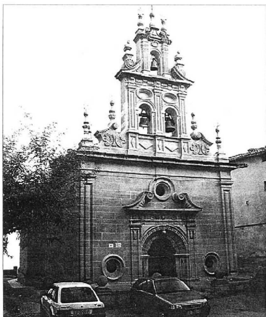
Ermita de Nuestra Señora del Valle, mostrando la fachada con la portada y la espadaña, una de las más armónicas y equilibradas del barroco en La Rioja.