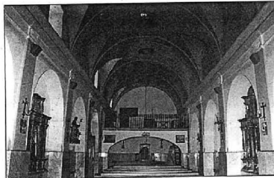
Interior de la nave hacia el coro alto, cubierta con bóvedas de lunetos separadas por arcos fajones de medio punto. Entre las pilastras que configuran los tramos de la nave, se abren huecos en el muro bajo arcos de medio punto para albergar retablos, altares e imágenes, a modo de capillas laterales.

Retablo barroco presidido por la talla románica de la Virgen del Monte. A los lados, las imágenes renacentistas de San Bartolomé y San Sebastián. Bóveda gótica decorada con ángeles músicos barrocos.