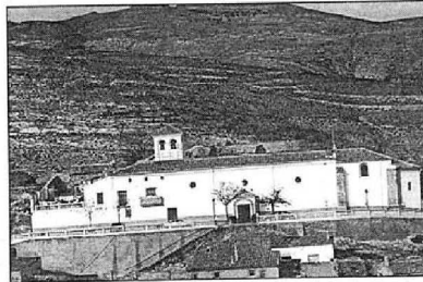
Fachada sur de la basílica. Abajo: Talla de la Virgen de Monte, siglo XIII.