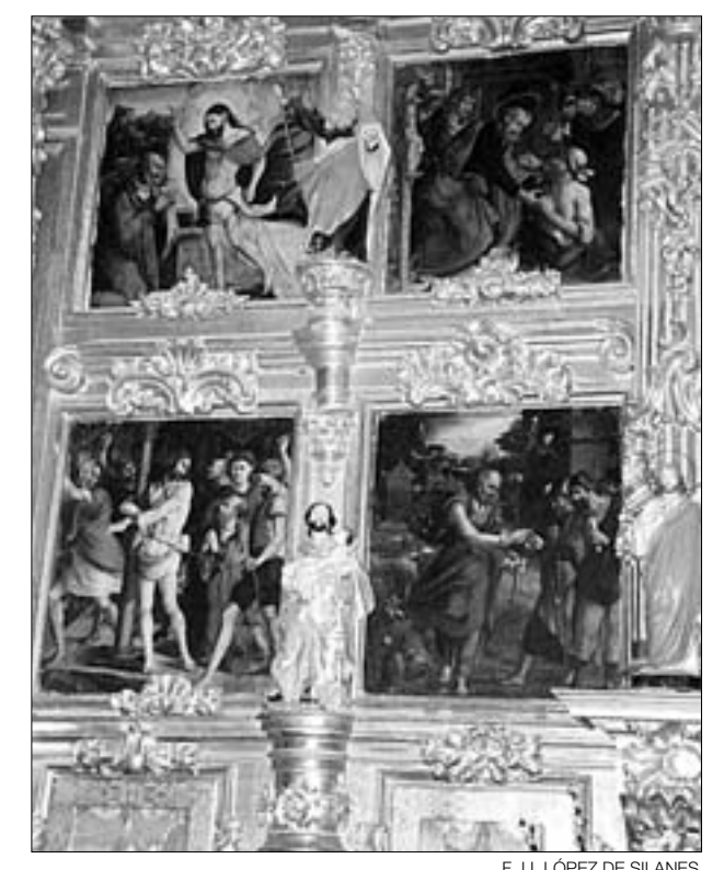
Pinturas del retablo mayor atribuidas a Andrés de Melgar

Lo más emblemático de la iglesia de San Pedro es su torre-campanario de estilo románico, posiblemente de finales del siglo XII y que se levanta al norte del templo