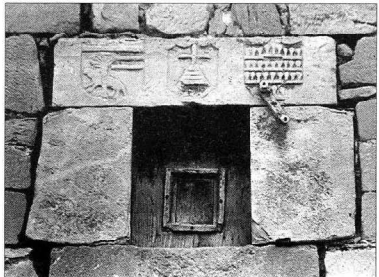
Dintel de una ventana de la casa del mayorazgo. El escudo de la izquierda es de la familia Vergara y el de la derecha de los Salazar. F. J. I. L. DE SILANES

te el renacimiento. El pósto de Venecia fue el modelo de funcionamiento para los países del Mediterráneo durante la Edad Moderna. Recordemos también que los sistemas bancarios y de crédito, estaban muy desarrollados e implantados en la Italia renacentista.