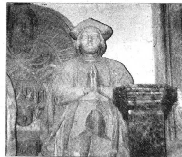
Estatua orante del Conde de Haro. F. J. I. L. DE SILANES