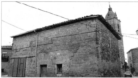
Vista actual de la Casa del Arca en donde se aprecia tanto el mal estado de conservación como la nobleza de su construcción y su ubicación privilegiada.

La repoblación de las tierras abandonadas por los árabes durante los siglos X y XI, dio acceso a la propiedad a los hombres libres, pero la mala fortuna de algunas cosechas hizo a estos pedir créditos a la nobleza y a las instituciones de la iglesia que luego no pudieron pagar. De esta manera, desde los siglos XII al XIV se observa una concentración de la propiedad de la tierra en manos de la nobleza y de la iglesia.