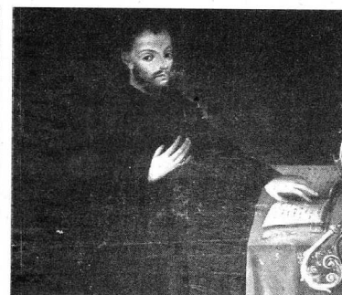
Abad de San Millán de la Cogolla.