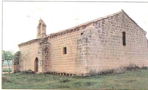
Fachada sur y este de Santa María en Cillas; arco triunfal, retablo y abside; y nave de dos tramos y coro de madera. Abajo, Santa María de Cillas del siglo XIV