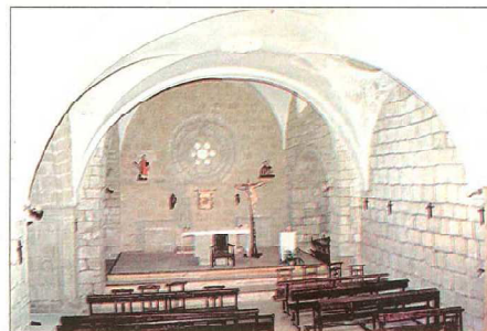
Presbiterio con un rosetón gótico y Santa María de la Antigua (XIV-XV) en San Esteban en Galbarruli