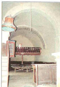
F. J. I. LOPEZ DE SILANES

El establecimiento del Císter en los Montes Ovarenes a finales del siglo XII en el Monasterio de Santa María la Real de Herrera, creó su área de influencia, en la comarca comprendida entre la Morcuera, las Conchas de Haro, y el río Tirón.