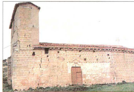
Fachada sur, puerta de ingreso y la espadaña-torre de San Esteban. A la derecha, Dolorosa procedente del Calvario del retablo de la Capilla de los López de la Bastida y conservada en Galbarruli.

La planta de la cabecera más estrecha que la nave, parece proceder de un torrión incorporado a la estructura de la iglesia en el siglo XIV, está dotado de unos muros sustancialmente más gruesos que los de la nave. El presbiterio carece de arco triunfal, si este presbiterio hubiera sido construido con tal fin, posiblemente hubiera incorporado el arco triunfal, tan emblemático en el románico. Exteriormente el tejado está sustentado por mensulones góticos, como los existentes en la iglesia de Cillas. La cubierta de la cabecera