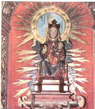
Una imposta lisa recorre la nave a menor altura que la del presbiterio.

La nave, algo más ancha, es posterior, el tejado se apoya sobre mensulones góticos en vez de utilizar canecillos, y fue posiblemente rehecha en parte en el siglo XVI; a esta época corresponden la puerta sur y la espadaña sobre dicha puerta. La nave está dividida en dos tramos por un arco fajón apoyado en mensulas, cubiertos con bóveda de cañón apuntado.