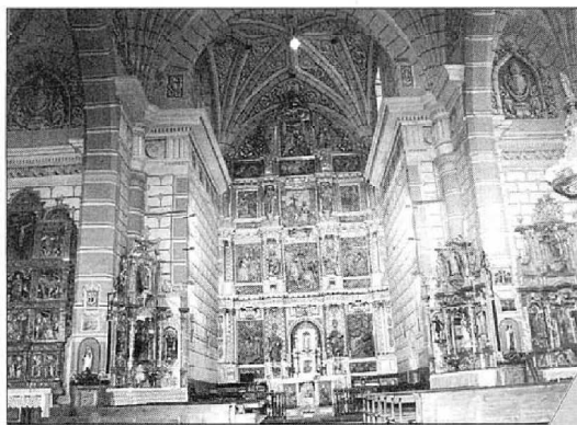
Arriba, dibujo de la portada gótica. Abajo, interior de la iglesia. A pie de página, vista del hastial oeste y de la torre; sobre la cima del monte del fondo se aprecian las ruinas del Castillo.

El retablo mayor es obra de Martín de Asturo y Domingo de Erdocia realizado hacia 1661. Consta de zócalo, cuatro pisos y ático, en tres calles y dos entrecalles. Está presidido por el relieve ecuestre de San Martín partiendo la capa, de tamaño mayor que el natural; completan el retablo otras escenas de la Pasión y de la vida de la Virgen.