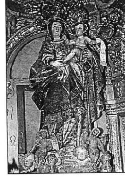
Ermita de Nuestra Señora del Patrocinio, en Pedroso