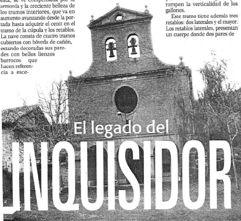
Ermita de Ntra. Sra. de PATROCINIO

Es una Virgen coronada, vestida con una túnica bajo un manto que despliega profundos pliegues, sujetando con su mano izquierda a un Niño desnudo, que tiene los pies y las manos en movimiento. Todo salido del tronco de un árbol que bajaba por el río, que fue rescatado de las aguas como el legado del inquisidor para la posteridad.