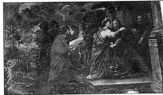
Arriba, de izquierda a derecha, imagen de Sta. Ana, retablo de San Juan Bautista, retablo de San José e imagen de N ra S ra del Patrocinio. Sobre estas líneas, perspectiva de la nave con cúpula y retablo mayor al fondo, y cuadro de la Visitación.

Texto y fotos F.J. Ignacio López de Silanes Valgañón