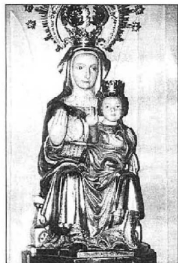
VIRGEN DE OLARTÍA Copia moderna de la imagen robada por Eric el Belga.