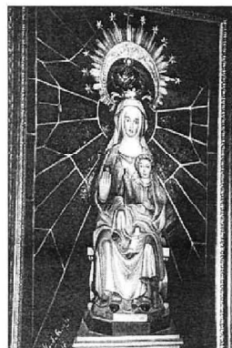
PINTURA DE LA VIRGEN DE OLARTÍA realizada y firmada por Eric el Belga.