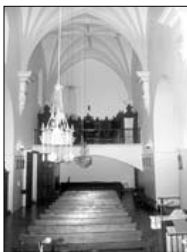
Vista del hastial oeste con la torre desde el pueblo y vista interior de la nave, con el coro alto al fondo con sillería.

micircular, para amadrigar las imágenes de Santa Bárbara del siglo XVIII, y Jesús Niño en uno, y en el otro a la Virgen del Rosario del siglo XVI, y a una Virgen del Pilar procedente de Valdeosera. En la sacristía resalta un retablo rococó procedente de Vellilla que sustenta un Cristo del XVII en el cuerpo y la Santa Faz en el ático. También hay que mencionar dos retablos gemelos de un cuerpo entre columnas entorchadas, rematados en frontón curvo y roto, procedentes de las capillas del primer tramo de la iglesia de la Asunción de Valdeosera.