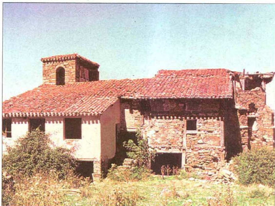
Iglesia de Nuestra Señora de la Asunción en Valdeosera y casa rectoral, fachada sur (siglos XIII al XVIII). Casa Solar del siglo XVII