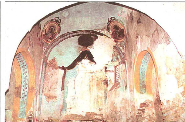
Primer tramo y presbiterio decorados a principios del siglo XIX de la iglesia de Valdeosera