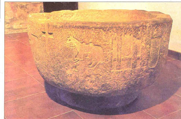
Pila bautismal que está en el museo del Solar de Valdeosera en San Román de Cameros