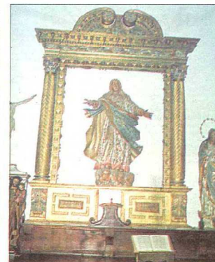
Retabliillo barroco que se encuentra en la parroquia de San Román. Archivo del Solar, en el museo