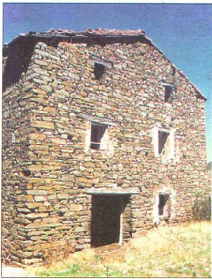
Casa gótica modificada en el siglo XVIII

La primera sorpresa fue observar que Valdeosera no se encuentra en un valle, sino casi en lo alto de una ladera, posiblemente porque Valdeosera se correspondía con el nom-