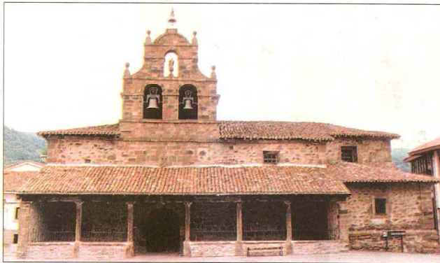
Fachada sur, pórtico y espadaña de tres huecos