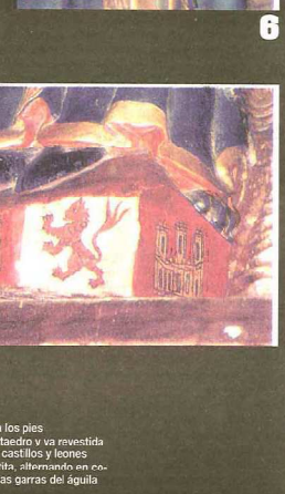
Foto 1: Nuestra Señora de Valvanera. El Niño mira torcamente hacia la corona de la Virgen, mientras que medio cuerpo hacia abajo se dirige hacia el lado opuesto. Esta postura del Niño es lo que más llama la atención y lo que la diferencia de las demás. Foto 2: el rostrillo es ovalado con púrpuras salientes; la nariz recta; boca afilada, sus ojos son grandes, negros y rasgados bajo unas pestañas finas y muy arqueadas. La Virgen lleva una toca blanca muy ajustada al cuello. Resplandece hasta en media luna, diadema y demás adornos a modo de casquete. Foto 3: el Niño está sostenido por la cintura con la derecha de la Madre; el libro abierto que tiene en la mano izquierda muestra trazos que simulan escritura; la mano derecha del Niño se eleva en actitud de bendecir. Su manto es una auténtica clamide inventada con la clásica vuelta sobre el hombro. Su pintura u ornamentación, lo mismo que su tónica, son similares a la de la Virgen. Foto 4: la túnica muestra en el centro una banda vertical dorada. Foto 5: la Virgen lleva una toca blanca muy ajustada al cuello y ricos vestidos con túnica y manto, adornados con conchas que imitan a pedrerías y cuentas de perlas. Foto 6: el asiento es una silla en tija o silla curul formada por cuatro águilas de las que se ven las cabezas y los picos. Sobre esta silla va un almohadón que lleva adornos geométricos y una cruz gamada roja en los ángulos. Lleva mangas