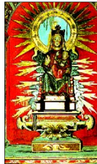
Nuestra Señora de Cillas, siglo XIII, Sajazarra. En el centro, Nuestra Señora la Antigua, siglo XIV, Galbarrufi. A la derecha, Nuestra Señora de Junquera, Treviana. Siglo XX.

En esta talla concurren los tres escudos de don Lope Díaz de Haro, lo que parece indicar que fue realizada para conmemorar las victorias de éste