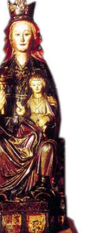
Nuestra Señora de Cillas, siglo XIII, Sajazarra. En el centro, Nuestra Señora la Antigua, siglo XIV, Galbarrufi. A la derecha, Nuestra Señora de Junquera, Treviana. Siglo XX.

En esta talla concurren los tres escudos de don Lope Díaz de Haro, lo que parece indicar que fue realizada para conmemorar las victorias de éste