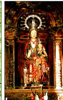
Nuestra Señora de Cillas, siglo XIII, Sajazarra. En el centro, Nuestra Señora la Antigua, siglo XIV, Galbarrufi. A la derecha, Nuestra Señora de Junquera, Treviana. Siglo XX.

En esta talla concurren los tres escudos de don Lope Díaz de Haro, lo que parece indicar que fue realizada para conmemorar las victorias de éste